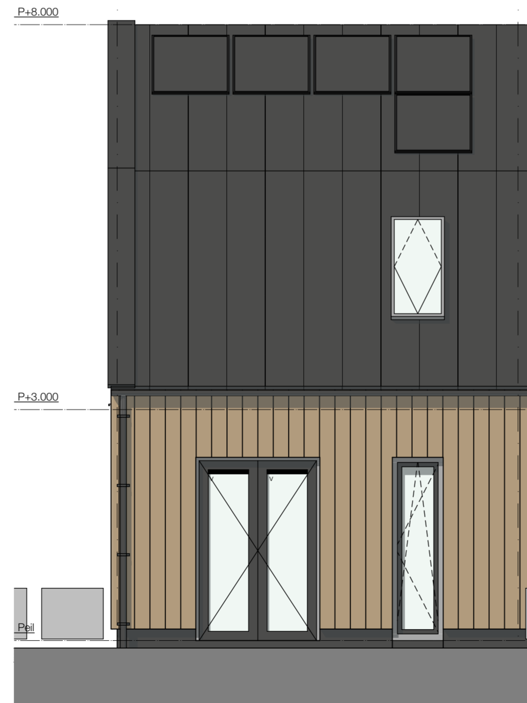
G2 Zuidoost gevel 1:50