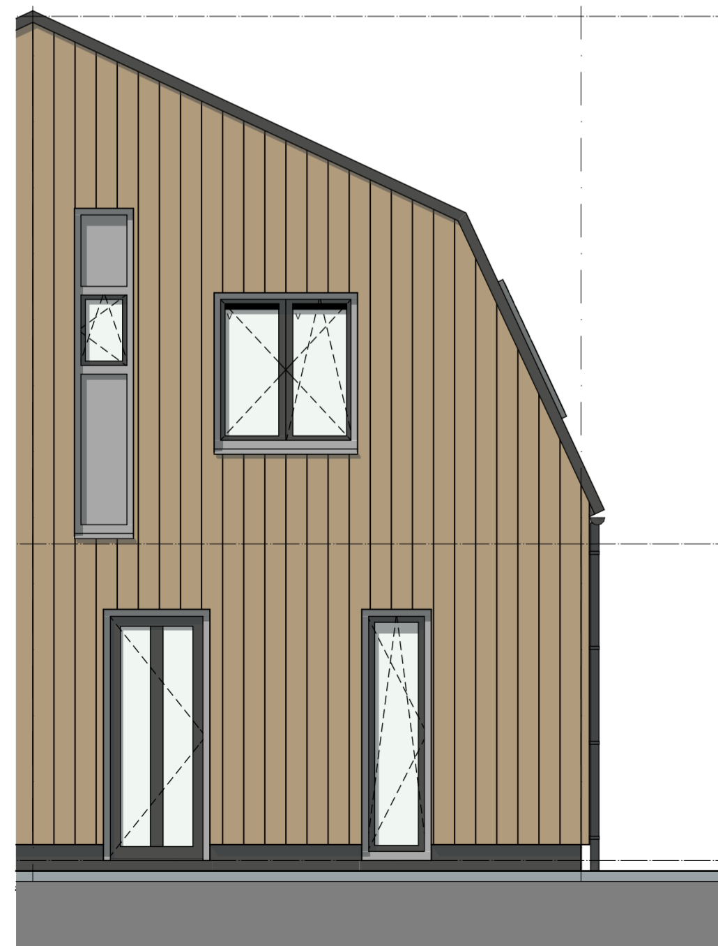
G1 Zuidwest gevel 1:50