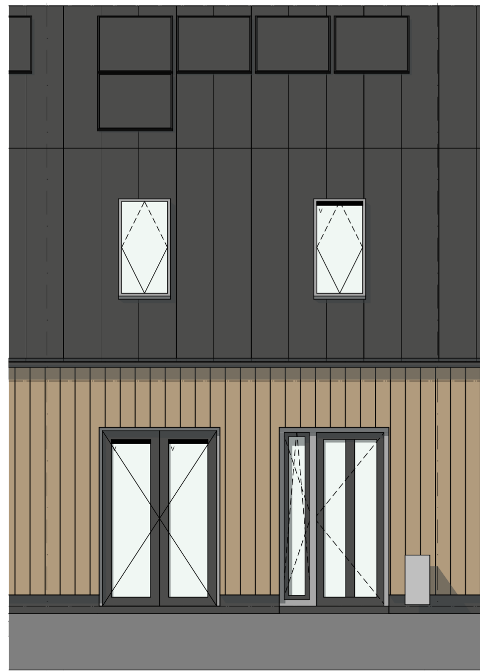
G4 Noordwest gevel 1:50